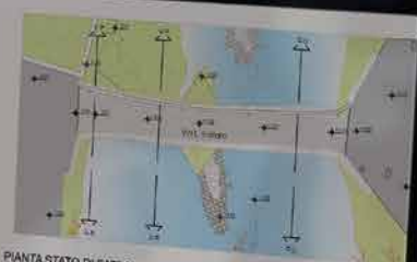
PIANTA STATO DI FATTO